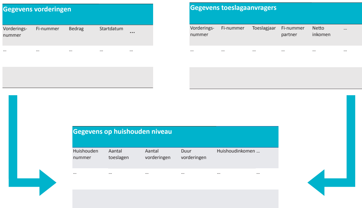
Figuur B1 Opbouw en combinatie van de gebruikte data-sets

We hebben deze gegevens op twee niveaus geanalyseerd: op niveau van verlagingen toeslagrecht en op niveau van huishoudens. Om dit te kunnen doen hebben we een nieuwe tabel gecreëerd waarin we de gegevens op het niveau van verlagingen toeslagrecht en op het niveau van toeslagontvangers geaggregeerd en gecombineerd hebben op het niveau van huishoudens. Dit is een tabel met een regel per huishouden met informatie over de terugvorderingen die huishoudens in de onderzoeksperiode hebben ontvangen en de kenmerken van huishoudens (zie figuur 1).